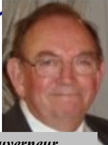
Gouverneur André Gerbet